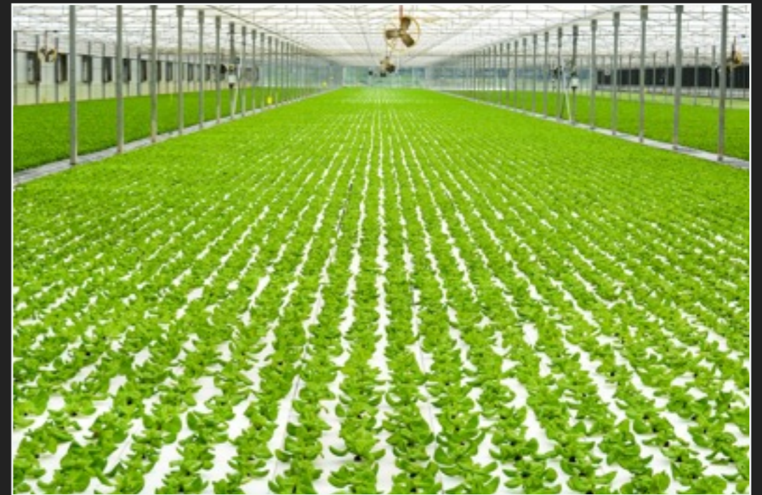
大规模生产型水培农场

水培种植具有不受土壤条件限制，无土传病害困扰，高产环保等优点，已成为高品质蔬菜生产的重要方式。已在荷兰、日本、美国等地区获得大规模推广。