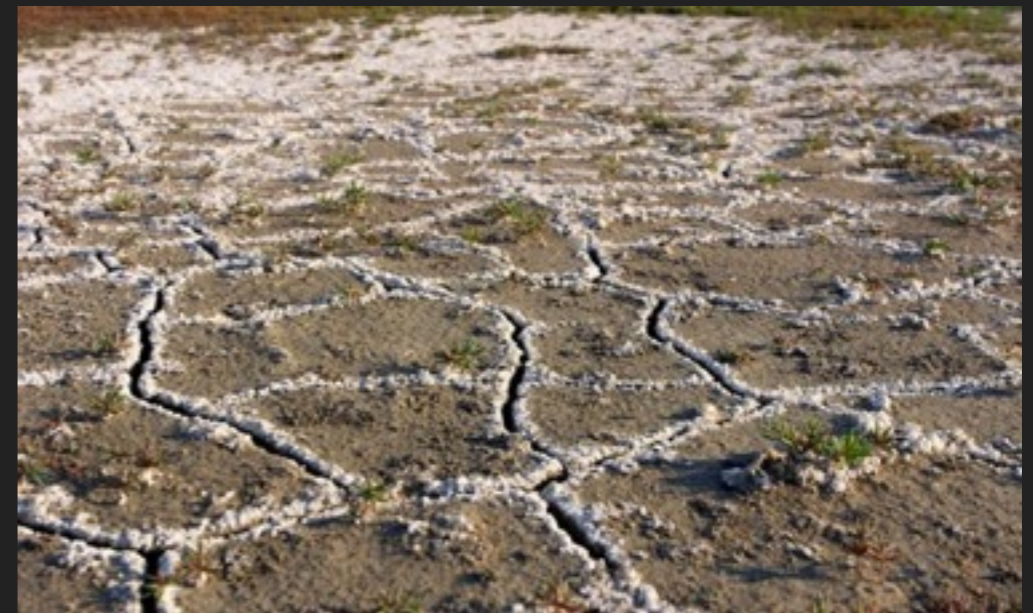
长期施用化肥造成土壤板结